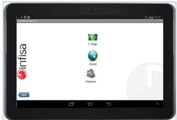
Pantalla de parámetros generales en AtlanticGes Mobile.