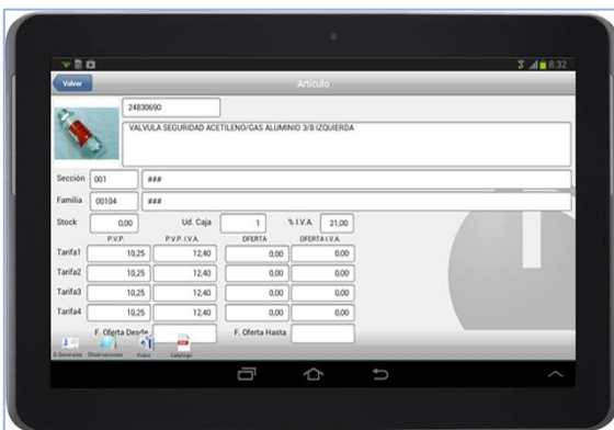
Pantalla de artículos en AtlanticGes Mobile.