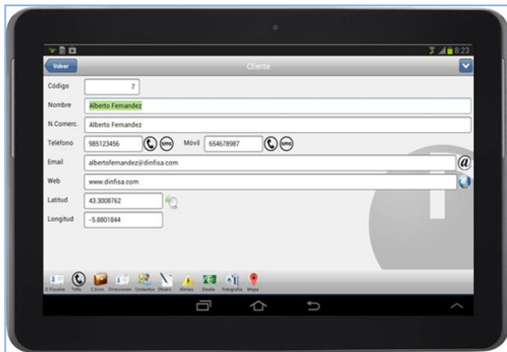
Pantalla de clientes en AtlanticGes Mobile.